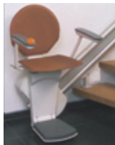
Silla salvaescaleras tramos rectos